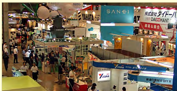
照片是上次展会的场景

2014 年日本 DIY 家庭用品购物中心展览会，将于 8 月 28 日（星期四）、29 日（星期五）、30 日（星期六）共三天，在千叶市幕张万国物产国际召开。