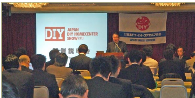
前回開催説明会の様子

2012年の本ショウに出展を検討される企業の皆様に本ショウの内容、趣旨を分かりやすく説明します。