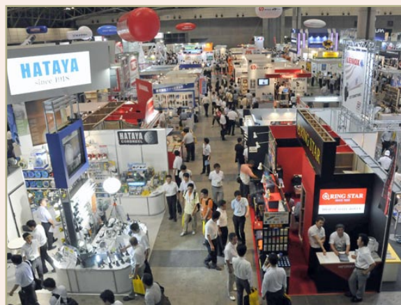
* 照片是上次展会的场景

2012 年日本 DIY 家庭用品购物中心展览会，将于 8 月 23 日（星期四）、24 日（星期五）、25 日（星期六）共 3 天，以三个展厅的规模，在千叶县幕张万国物产国际展示场召开。2012 年日本 DIY 家庭用品购物中心展览会的主题是“以理想为动力！-Make Your Dreams Your Power!-”。这次迎来了第 48 次展览会，参展公司范围很广，为了参观者以及令人满意的搭配，重新扩充编制了参展品种，新颖的规划齐备，希望能成为支持日本的生活的“底气”。