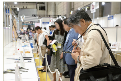
日本 DIY 商品大赛

① “日本 DIY 商品大赛”，对参展企业应征的新商品等进行审查，选出经济产业大臣奖、日本 DIY・HC 协会会长奖等优秀奖进行表彰。