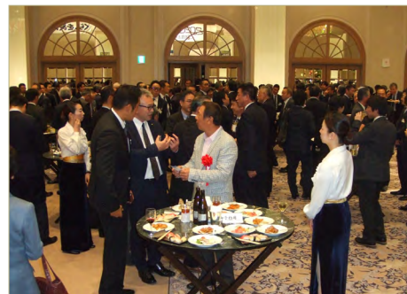
新年賀詞交歓会風景