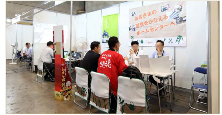
ホームセンタービジネスマッチング

出展企業向けイベントは、日本 DIY 商品コンテスト、ホームセンタービジネスマッチング、業界懇親パーティそして協会 社団法人設立 40 周年を記念しアメリカの The Home Depot、ヨーロッパの OBI 等海外大手ホームセンターと国内大手ホームセンターの経営トップによるパネルディスカッション等を計画しております。