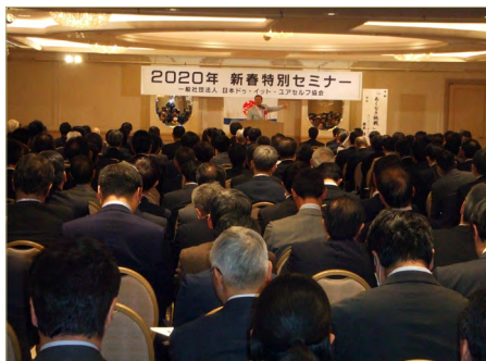
新春特別セミナー風景

日本 DIY 協会は、2020 年 1 月 29 日（水）に新年賀詞交歓会を第一ホテル東京（JR・新橋駅前）で開催いたしました。賀詞交歓会前の新春特別セミナーは、オリンピック金メダリストの森末慎二氏を講師に「あくなき挑戦」を演題に開催しました。会員社や報道関係など 430 人を超える方々の参加で、大変賑わいました。