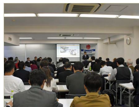
上次（2019 年 11 月）举办说明会的情景

本展在 2020 年 11 月 5 日（星期四）、6 日（星期五）、7 日（星期六）共三天，使用幕张国际展览中心的 5 个大厅（预定），以国内外 500 家企业 1200 个展柜出展、10 万人参观为目标。期待着在本展上考虑参展的企业、团体以及媒体相关人员的参加。