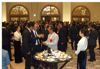
新年祝词联欢会的场景