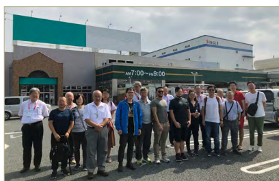
参观家居中心等巴士参观团

参观家居中心等巴士参观团 ，计划在举办结束的第二天即星期天，参观幕张会场附近有名气的店。参观前，以屈指可数的家居中心的顶级经验者为讲师，召开以日本家居中心市场为中心的研讨会。参观后共进午餐，同时参加者之间进行沟通和信息交流。参加需要费用。