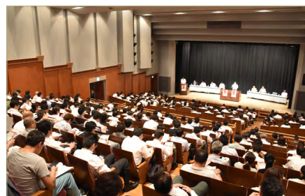
前回出展社説明会

6月25日（火）午後1時30分から、亀戸文化センター（東京都江東区亀戸2-19-1、JR亀戸駅徒歩2分）で開催します。詳細は、追って出展企業の方々へご案内いたします。