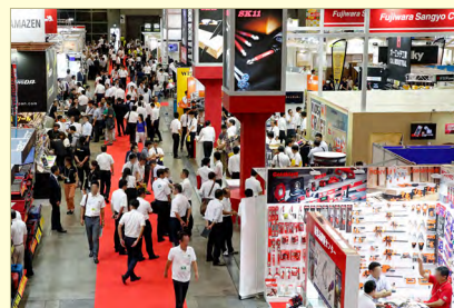
写真は前回ショウの様子

JAPAN DIY HOMECENTER SHOW 2019 のショウテーマは、「～ホームセンターでを見つけよう～ DIY で自分らしく」です。本ショウは、住まいと暮らしに関わる日本最大級のトレード & パブリックショウです。「DIY を個人、家族、仲間と楽しむこと」を推奨し、暮らしに役立つ様々なノウハウの紹介と斬新な企画イベントを用意し、皆様の期待に応えられるよう努めてまいります。