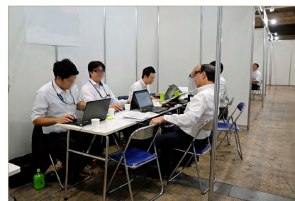
ホームセンタービジネスマッチング

恒例の「ホームセンタービジネスマッチング」は、ショウ期間中、出展社の商談・相談の場として、国内有数のホームセンターバイヤーが常駐する商談ブースです。「短時間で集中して多くの商談ができる」、「新しい商材や海外を含めた新規企業の正確な情報を得られる」等、毎回好評を得ています。このイベントから取引開始または後日商談に結び付いた出展企業が多くあります。昨年の参加小売業は、(株)アヤハディオ、(株)エンチョー、コーナン商事(株)、(株)ジョイフルエーカー、DCMホールディングス(株)、(株)ホームセンターバロー、(株)ユーホー、(株)LIXIL ビバ、ロイヤルホームセンター(株)の各社です。今年も上記企業その他、有力小売業が参加予定です。