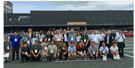
参观家居中心等巴士参观团

『男人的工坊』、『儿童子·未来区』、『亮丽！DIY女士』3大区域，是即热闹又促进参观的活动，参观者可以参加制作。