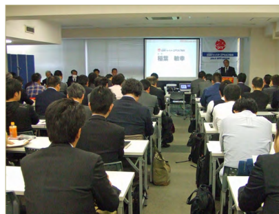
2018 展览会的召开说明会