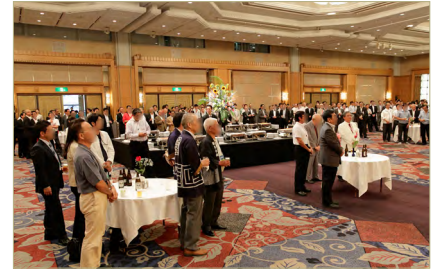
前回・懇親パーティ風景

初日ショー終了後開催される懇親パーティは、製造、卸売、小売の三業種の業界関係者が一堂に会する情報交換と懇親の場です。