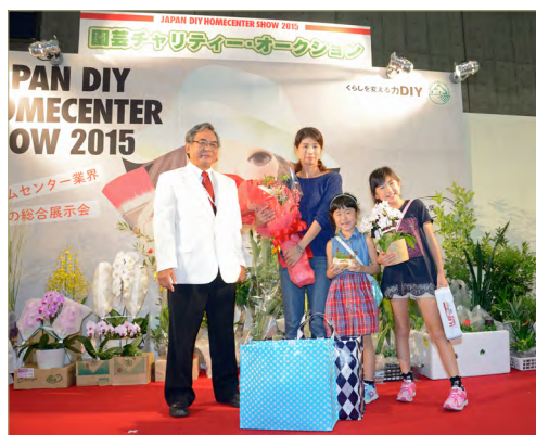
来場 600 万人達成