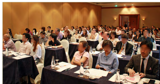
バンコクでの海外出展説明会の様子