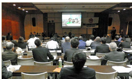
上次（2014 年 11 月）说明会的盛况

在会上，向有意参加 2016 年展示会的各企业，易懂地介绍本次展示会的内容及宗旨。介绍 DIY 家庭用品购物中心业界的动向。