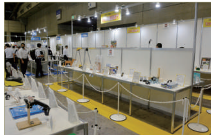
日本DIY商品コンテスト

出展企業から応募いただいた新商品等を審査し、経済産業大臣賞、日本DIYホームセンター協会会長賞はじめとする優秀賞を選定します。