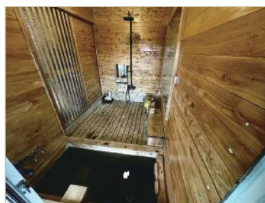
「JAPAN DIY 大賞 2021」 一般部門最優秀賞