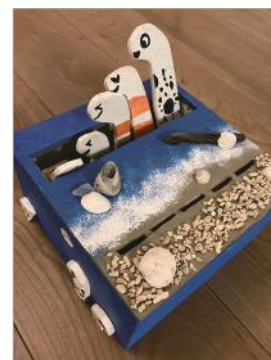
「JAPAN DIY 大賞 2021」 KIDS 最優秀賞