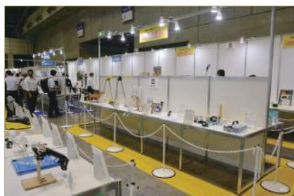
日本 DIY 商品コンテスト

来場者促進イベントは、出展企業の協力による来場者参加の「 ワークショップ 」、「 お楽しみ抽選会 」等来場者が楽しみながら暮らしの知識が得られます。「 JAPAN DIY 大賞 2023 」、「 チャリティーオークション 」等をはじめ来場者に喜んでいただける多数のイベントを計画しております。