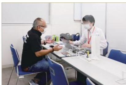
ホームセンタービジネスマッチング