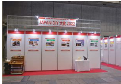
JAPAN DIY 大賞 2022 展示