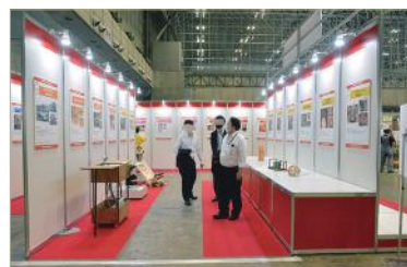
「JAPAN DIY 大賞 2021」展示