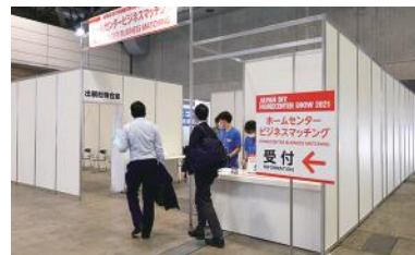
「いつでも頼れるホームセンター」展示

全国のDIYerから応募いただいたDIY作品（写真）を審査し、優秀賞を決定します。