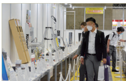
日本 DIY 商品大赛

举办结束后的第二天 8 月 27 日（星期日），出游访问幕张展览馆近郊的大型零售店。