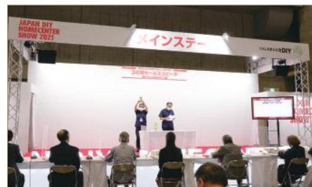
日本 DIY 商品大赛 (2021 年) 的 3 分钟销售演讲

以参展公司为对象, 广泛征集新商品等 DIY 家居中心商品, 除了选出经济产业大臣奖、日本 DIY・家居中心协会会长奖等优秀奖之外, 由到场的业界人士、一般到场者投票选出的商品也将予以表彰。