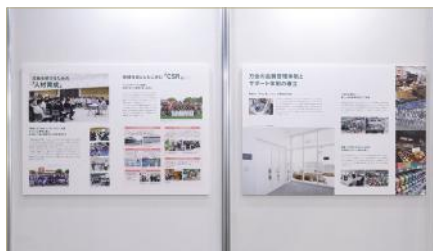
「随时可以依赖的家居中心」展示