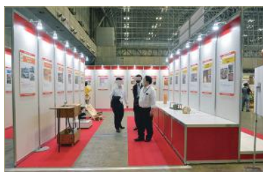
日本 DIY 大奖 2021 展示

面向参观者的促进活动，设定了“随时可以依赖的家居中心”、“款式升级改造”、“从 DIY 开始的 SDGs” 3 个主题区域。我们正在讨论家居中心的介绍、DIY 再创新趋势的传播、SDGs 工作坊等广泛年龄层都能参加的企划。另外，计划了总奖金 80 万日元的“日本 DIY 大奖 2022”，出展企业协助的参观者参加的“工作坊”等能让参观者积极参与的多项活动。