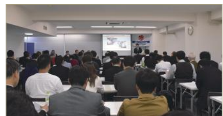
上次（2019 年 11 月）举办说明会的情况

我们将为参展企业创造与以家居中心为首的零售业进行交易的机会，并准备满足参展商期待的活动。关于展会的运营，我们会对相关人员进行事前的 PCR 检查，以及展会期间的抗原检查等，为了让展会安全、放心地参加展出，我们将全力以赴。