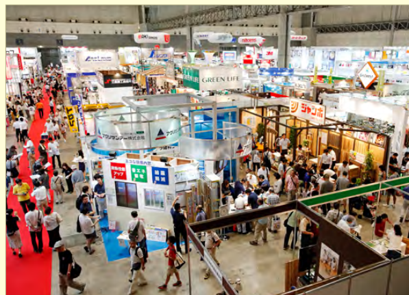
* 照片是上次展会的场景

2013 年日本 DIY 家庭用品购物中心展览会的主题为“让明天 Dreaming ~ 世界充满了很多的梦想~”。这次迎来了第 49 届，增加了女士感受到的 DIY 的新展品，提供各个领域的参展商和方方面面的访客都能满意的富有魅力的新提案。