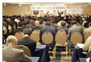
上次・2012 年度通常大会

日本 DIY 协会，将于 6 月 5 日（星期三），在第一宾馆东京（JR・新桥站前）召开 2013 年度定期大会，这是一般社团法人移交后的第一次会议。当天邀请大班经济大学的客座教授经济评论家冈田晃先生为讲师，以「在 M&A 的先驱者毛利元就先生的『三根箭』中隐藏的战略」为题材进行纪念演讲。