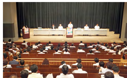
上次参展公司说明会

英语网站： http://www.diy-show.jp/2013/e/index.html