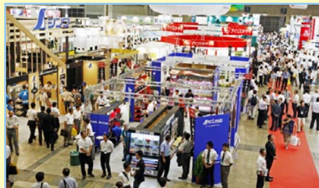
*写真は前回ショウ 2010

JAPAN DIY HOMECENTER SHOW 2011 実行委員会は、夏休み恒例のビッグイベント JAPAN DIY HOMECENTER SHOW 2011 を、2011年8月25日（木曜日）から27日（土曜日）の3日間、千葉市幕張メッセ国際展示場で開催いたします。