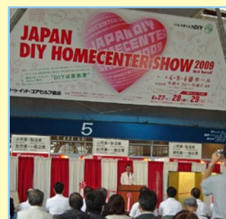
*写真は前回ショウ 2009

初日はバイヤーズ・デー、2日目はバイヤーズ・デーと販わいのある一般PR・デー、3日目は一般PR・デーで開催し、3日間の総来場者数は10万人を予定しています。