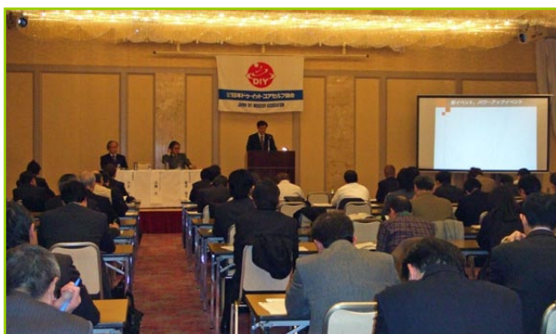
開催説明会の様子

新規出展社への出展促進活動の一環として JAPAN DIY HOMECENTER SHOW 2010の開催説明会が、2010年2月24日(水)、東京・四谷のスクワール麹町で開催されました。