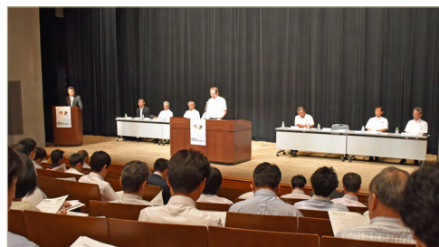
前回出展社説明会

記者発表会は出展社説明会に先立ち、同センター 2 階大研修室で午前 11 時 30 分から行います。