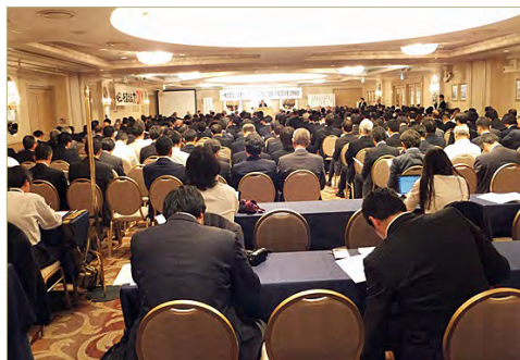
平成 28 年度定時総会及び懇親パーティ風景